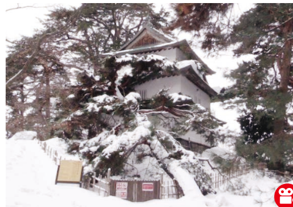
弘前城二の丸未申櫓(国重要文化財)の底部分に、雪の重みにより倒れたマツが直撃。大きく壊れる被害が出た。

記録的な大雪にみまわれた2024-2025年シーズン。弘前市では 2025年2月23日に観測史上最深となる積雪160cmを記録。降雪量は623cmに 。冬期を通して除雪作業中の事故や公共交通機関の運転見合わせが相次ぐなど、市民生活に深刻な影響を及ぼしました。弘前公園では、大雪による倒木や幹折れ、枝折れなどの被害が発生。園内通行の安全を確保できないことから園内の大部分が一時立ち入り禁止に。大雪被害は甚大で、国重要文化財である弘前城二の丸未申櫓 ひつじまのやぐら や二の丸東門 ひがしうちもん (東内門)に倒れたマツが直撃し破損するなどしました。