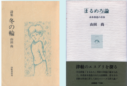
『冬の輪』 津軽書房 (昭和58年11月20日) 『まるめろ論 高木恭造の青春』 津軽書房 (昭和54年6月30日)

本展は、令和6年1月に逝去した山田尚を追悼し、その詩業を中心に文学的業績を概観するものです。