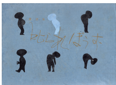
『叱られぼうず』 全音楽譜出版社 昭和28年