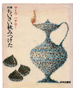
『ちいさい秋みつけた』 みゆき書房 昭和43年

サトウハチローは、明治36年(1903年)、弘前市出身の小説家・佐藤紅緑の長男として東京都に生まれ、今年で生誕120年を迎えました。本展は、この節目の年にあたり、すぐれた抒情詩、童謡、歌謡曲などで一世を風靡した、詩人・サトウハチローの詩業を概観します。