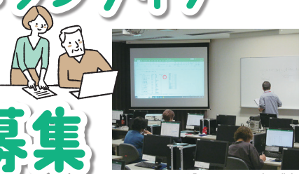
令和5年9月19日実施「エクセル2019応用講座」