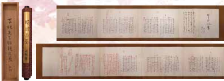
句稿「子規先生鉗鎚遺墨」(個人蔵)

明治31年10月の紅緑の句稿「かりがね集」に、正岡子規が朱で評点・評語を加えたもの。子規は巻末に総合的な句評と近況、11月24日の日付を書き記している。本句稿は『俳諧紅緑子』(明治37年)に、「俳三年」と題する紅緑の句稿の一つとして、「かりがね集」の名で収められている。子規31歳・紅緑24歳、「新俳句」の勃興・隆盛期の息吹を伝える貴重な資料である。