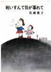
『戦いすんで日が暮れて』 講談社 昭和44年4月 第61回直木賞受賞(昭和44年7月)

作家・佐藤愛子は、大正12年(1923年)に佐藤紅緑とシナの二女として生まれ、今年、生誕100年を迎えます。昭和25年、同人雑誌『文藝首都』に処女作「青い果実」を発表。44年「戦いすんで日が暮れて」で直木賞を、54年に『幸福の絵』で女流文学賞を受賞。平成12年、佐藤家の人々の「荒ぶる血」を描いた大河小説「血脈」で菊池寛賞を、27年『晩鐘』で紫式部文学賞を受賞します。ユーモラスなエッセイにもファンが多く、28年『九十歳。何がめでたい』が大ベストセラーとなりました。本展は、数多くの佐藤愛子の著作の中から文学賞受賞作を中心とした代表作を展示し、その魅力を紹介するものです。