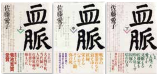
『血脈上・中・下』 文藝春秋 平成13年1～3月 第48回菊池寛賞受賞 (平成12年10月)