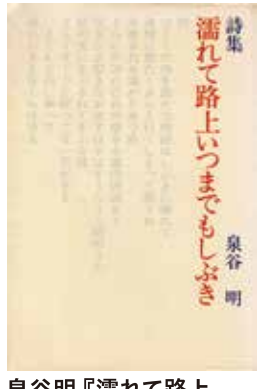
泉谷明『濡れて路上 いつまでもしづき』 津軽書房 昭和51年7月20日