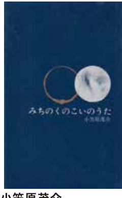
小笠原茂介 『みちのくのこいのうた』 津軽書房 昭和56年10月28日