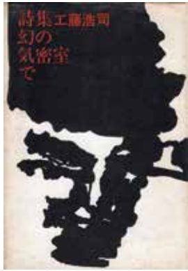
工藤浩司『幻の気密室で』 津軽書房 昭和45年5月1日

スポット企画展は、常設展・企画展に加え、折々の話題や新しく収蔵した資料などを随時紹介する小規模企画展として、平成11年度より開催しているものです。このたびは、「弘前の詩人たち～1960年代から現代(2)」をテーマに開催します。本年度、当館では第46回企画展「追憶と郷愁の詩人 一戸謙三」を開催していますが、謙三が詩人として活躍した弘前市からは、その後も多くの詩人たちを輩出しています。その中から、1960年代から現代まで活躍した弘前の詩人たちを3期に分けて展示します。本展では、その第二弾として、1930年代に生まれた泉谷明、小笠原茂介、工藤浩司の3人の詩人について紹介します。