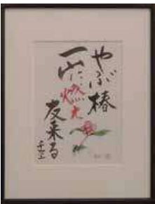
成田千空色紙(書・画 櫻庭利弘) 「やぶ椿一山に燃え友来る」千空生誕100年を記念して制作したもの。