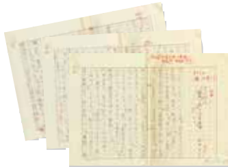
成田千空 原稿 四季開花「樹頭の花」 11月号選評(平成12年『萬緑』11月号掲載) 千空は、昭和63年(1988)から俳誌『萬緑』選者となる。