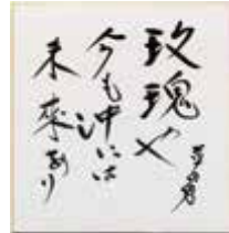
色紙「玫瑰や今も沖には 未来あり 草田男」(複製) 句碑は青森県立図書館「文学の小径」に 平成9年7月5日に建立された。