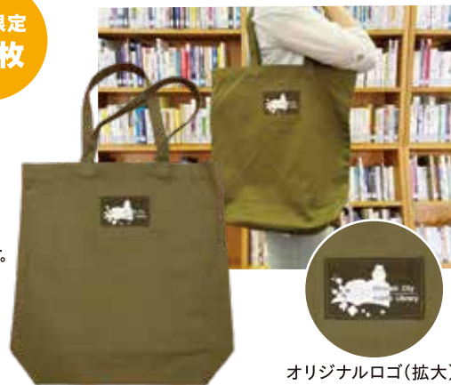
オリジナルロゴ(拡大)